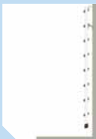
→ Hyllstege i viloläge.