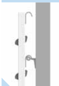
→ Övre krok för uppgång. → Nedre krok för viloläge.

Mer information om de olika stegtyperna hittar du på sidorna 5 – 6. Rör och konsoler hittar du på sidan 17.