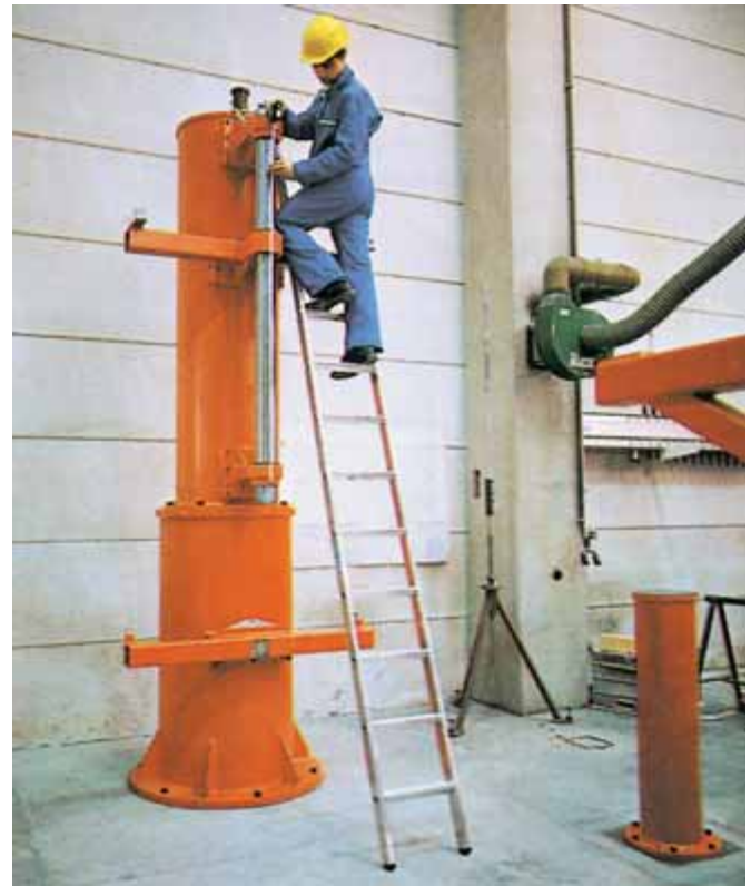
Z600 – Enkelstege med breda fotsteg i extra robust utförande