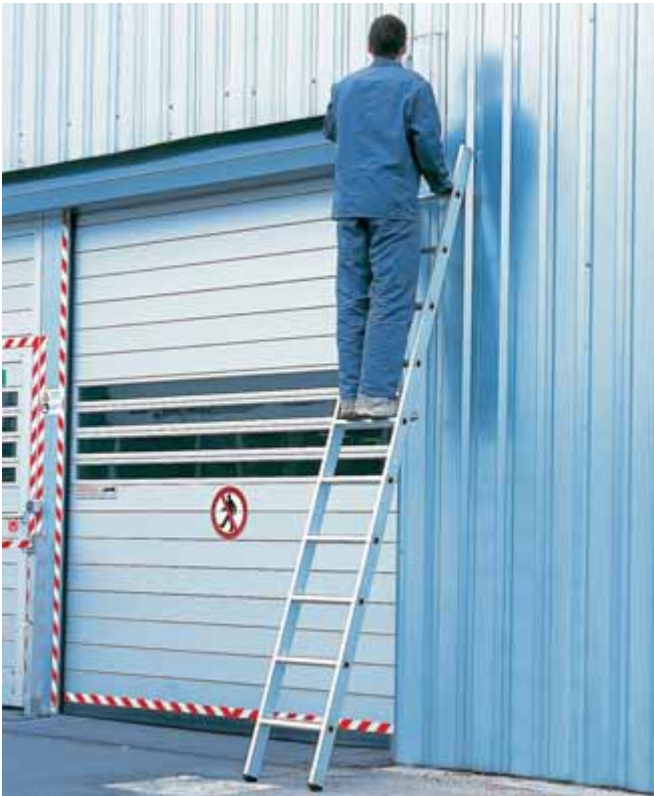
Z600 – Enkelstege ESI